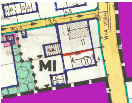
Auszug aus dem Bebauungsplan „Zwischen Römer- und Bietstraße“

Das Plangebiet liegt im Geltungsbereich des Bebauungsplans „Zwischen Römer- und Bietstraße“, Ursprungsfassung rechtsverbindlich seit 1976.