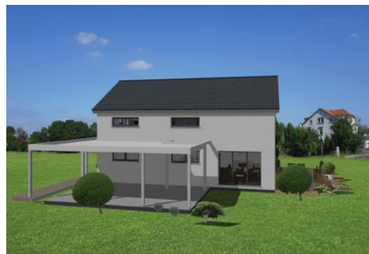
Nordwest- und Südwestansicht geplantes Wohnhaus, Fa. Stenger,

Geplant ist ein Wohnhaus, das alle Kriterien der Urfassung des Bebauungsplans mit Ausnahme der Carportdachhöhe einhält, wenn nicht der Bauleitplan im rückwärtigen Bereich Bauflächen ausschließen würde.