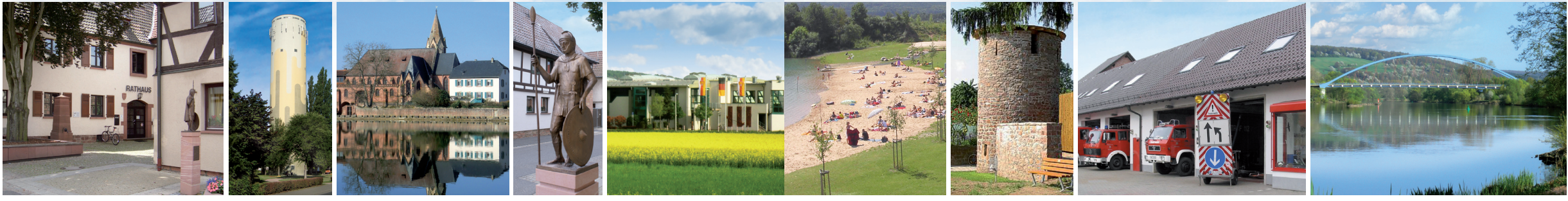
Überreicht von Ihrer Gemeindeverwaltung

Gemeinde Niedernberg Einwohner: 4.950 in Zahlen: Fläche: 15,1 km 2 , 118 über NN. Kreis: Miltenberg Regierungsbezirk: Unterfranken Bundesland: Bayern